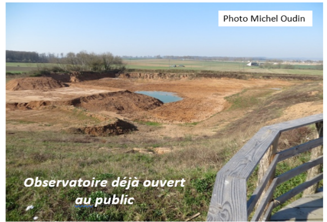
Esquisse paysagère réaménagement GRANULATS VICAT (F Robin)

Ce réaménagement, réalisé au fur et à mesure de l'avancement de l'exploitation, s'intègre parfaitement à notre territoire et respecte les enjeux environnementaux .