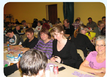
Soirée Loto - A qui la chance ?