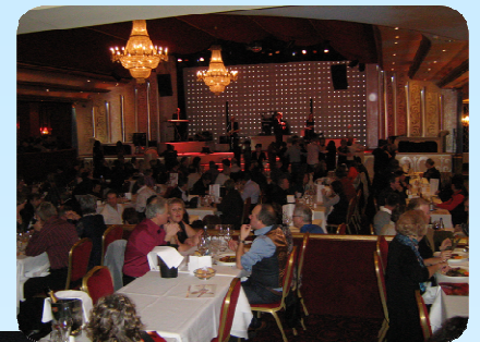
Oh mon grand lapin !