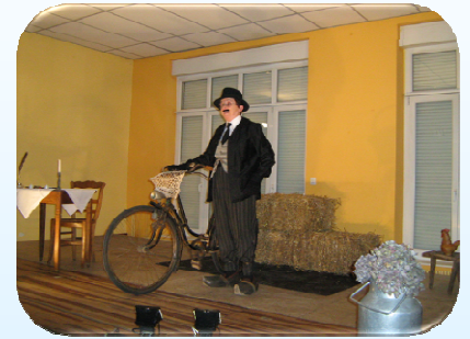
Après avoir été chez le dentiste, le grand écart !!!