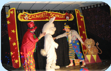
Cacahuète, Schnouki et tous les enfants sur la piste !!!