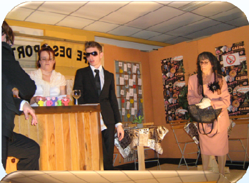
Docteur, ne me faites pas mal SVP !!! J'ai trop peur !!!