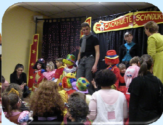
Trop cool le Président avec les enfants !